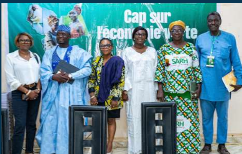
Sarh (Tchad) - Dec 2025 Forum Economique TAS 2025 §Structuration et animation du Concours Startups Green Tech par AfricAdvice