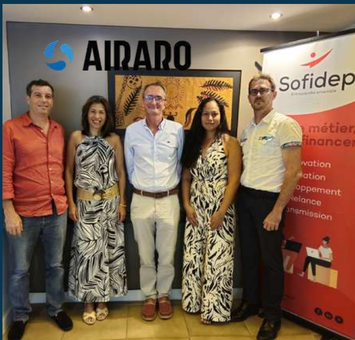
AIRARO (IOM6) - Polynésie, Or Bleu : 1M€ (SOFIDEP) / Partenariat avec FLOCEAN