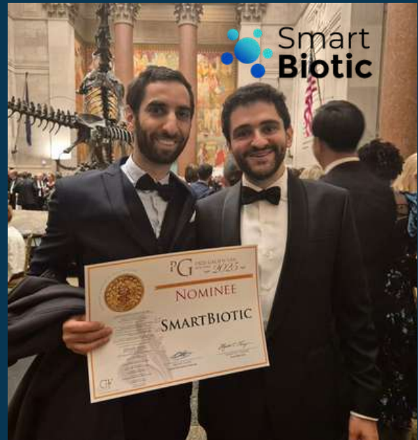
SMARTBIOTICS (IOM8 et 9) - Martinique, Santé: 1,2M€ (BPI, Roundtable) / Nominé prix Galien US