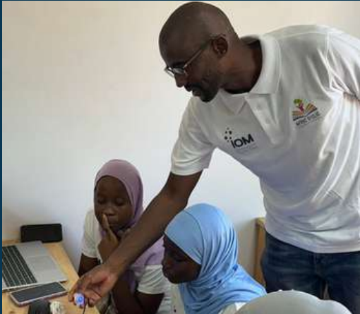
Dakar (Sénégal) - Fév, Mars et Oct 2025 Visite startups Guadeloupéennes, Ateliers technologiques et de structuration avec Afric'D'Clic