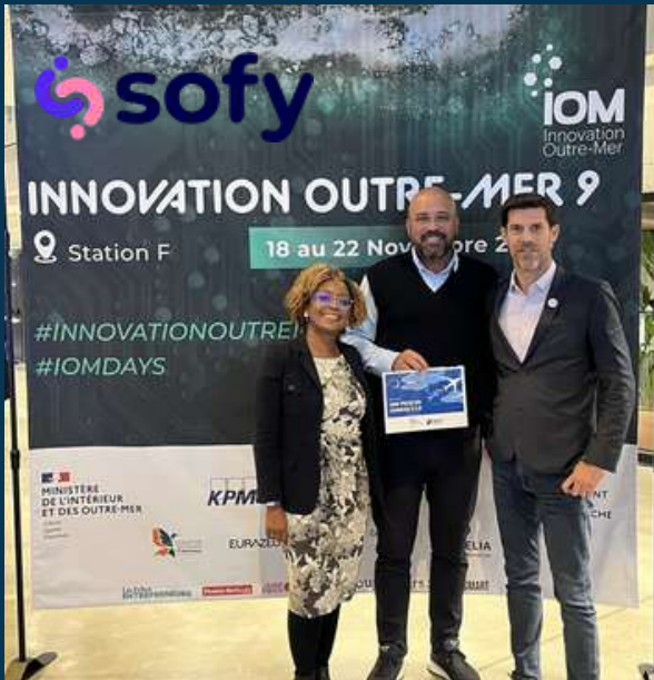
SOFY (IOM9) - Guadeloupe, Digital : 1,5M€ (Elevation Capital)