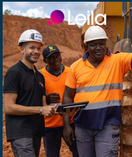
LEILA (IOM9) - Guyane, Digital: 500K€ (CNES, BPI, BA)