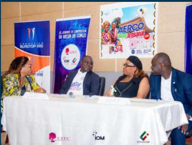
Brazzaville (Congo) - Sept 2025 JIBC (Journées de l'Innovation du Bassin du Congo) avec AfricAdvice, Unicongo, Bangui Hub, CAF